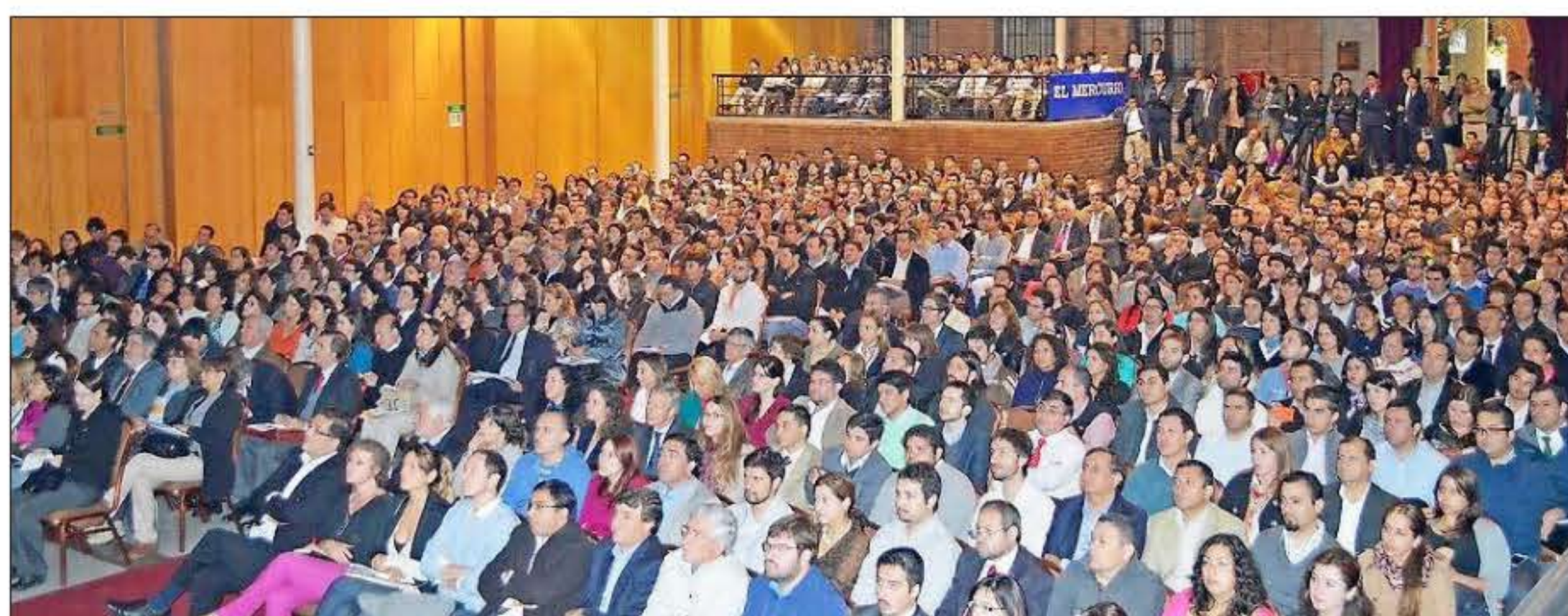
Los asistentes en el Salón Fresno del Centro de Extensión UC.